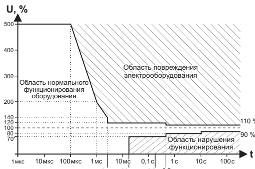
Рис. 1. Кривая работы электрооборудования ITIC (CBEMA), ( http://www.home.agilent.com/upload/cm_upload/All/1.pdf?&cc=UA&lc=eng ).